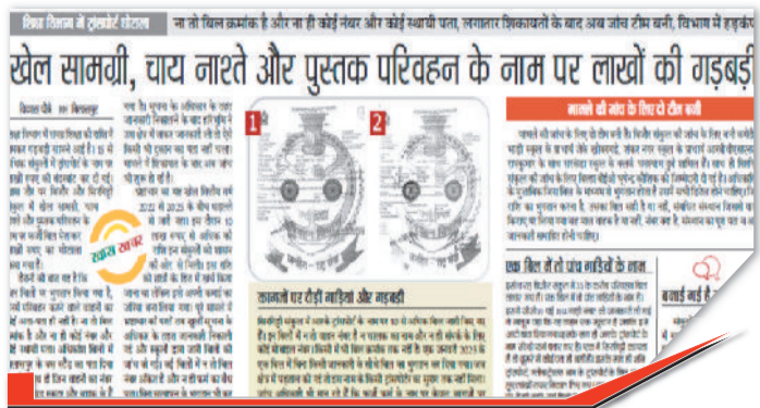
हरिभूमि में प्रकाशित खबर।

बिलासपुर। शिक्षा विभाग में गड़बड़ियों की परत दर परत खुल रही हैं। जिन संकुल समन्वयकों को व्यवस्था सभालने के लिए नियुक्त किया गया था उन लोगों ने फर्जी इसे कमाई पाए गए का