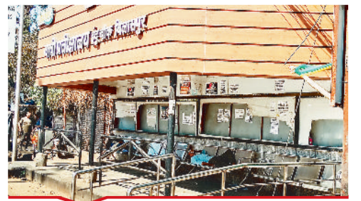
इंदु चौक पर स्मार्ट सिटी द्वारा बनाया गया बस स्टॉप लोगों के सोने के काम आ रहा है।

[ बिल्हा | मस्तूरी | तखतपुर | मुंगेली | कोटा | लोरमी | सरगांव | पेंड़ा | बेलतरा | रतनपुर | पथरिया ]