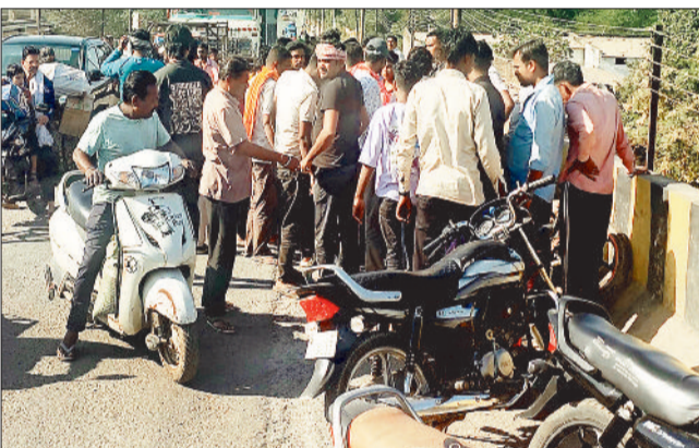
घटनास्थल पर लगी लोगों की भीड़।